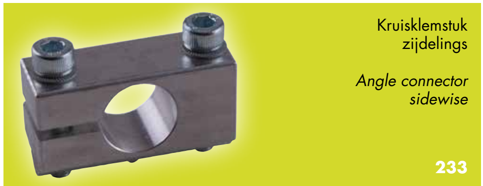
Kruisklemstuk zijdelings Angle connector sidewise